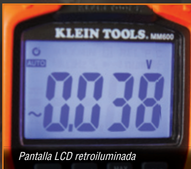
Pantalla LCD retroiluminada

Los multímetros MM600 y MM700 vienen con una bolsa de transporte de nylon, cables de prueba, pinzas tipo cocodrilo, baterías y termopar con adaptador.