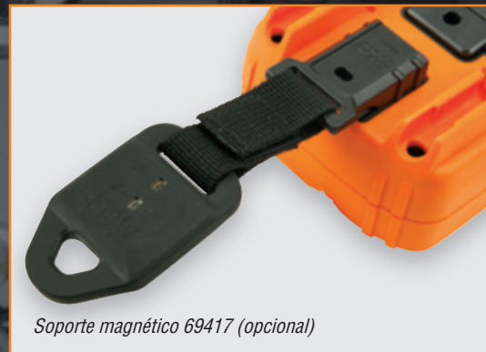
Soporte magnético 69417 (opcional)