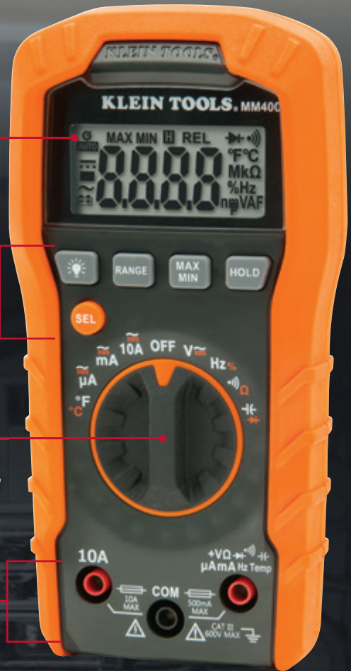
Se ilustra el modelo MM400.

Conectores de entrada para cables de prueba