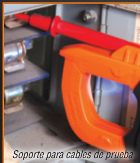
Soporte para cables de prueba