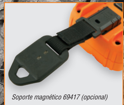
Soporte magnético 69417 (opcional)