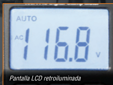
Pantalla LCD retroiluminada

También disponible: Kit de prueba y mantenimiento eléctrico CL110KIT . Incluye el multímetro de gancho CL110, el probador de receptáculo RT210 GFCI y el divisor de línea \times 10 69409, una bolsa de transporte de nylon, cables de prueba y baterías.