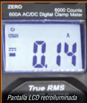
Pantalla LCD retroiluminada