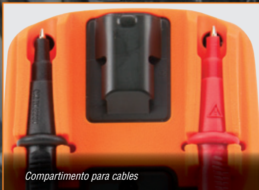
Compartimento para cables