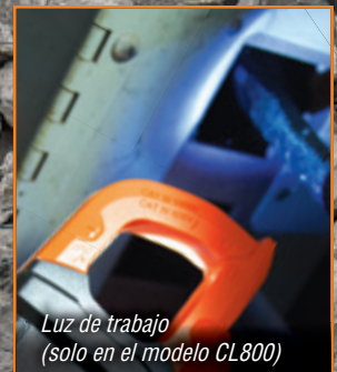
Luz de trabajo (solo en el modelo CL800)