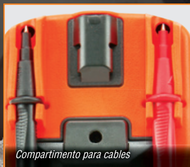
Compartimento para cables