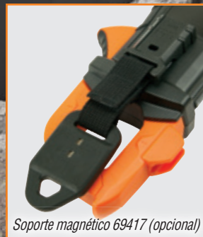
Soporte magnético 69417 (opcional)