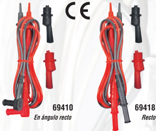
69410 En ángulo recto

Compatibles con todos los multímetros Klein y con la mayoría de los multímetros de otras marcas. Incluye pinzas tipo cocodrilo a rosca. Clasificación de seguridad: CAT IV 600 V, CAT III 1000 V