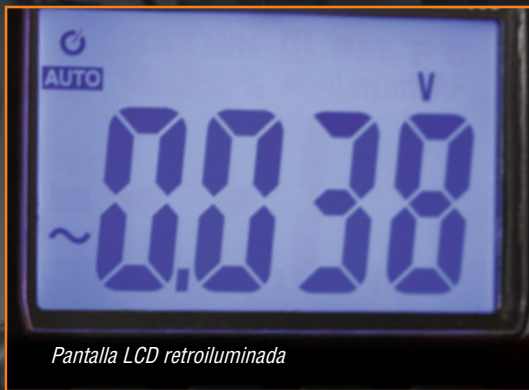
Pantalla LCD retroiluminada

Los multímetros MM300 y MM400 vienen con cables de prueba y baterías. El multímetro MM400 también incluye un termopar con adaptador.